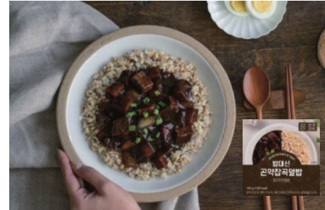
밥대신 곤약잡곡덮밥 유니치킨짜장