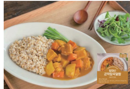
밥대신 곤약잡곡덮밥 버터치킨커리